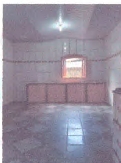
FOTO: COZINHA/ COPA