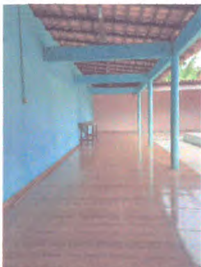
FOTO: ÁREA DE CIRCULAÇÃO 2