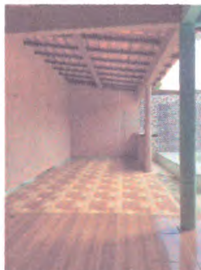
FOTO: ÁREA DE CIRCULAÇÃO 3