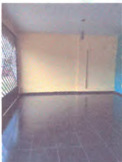
FOTO: ÁREA DE CIRCULAÇÃO 4