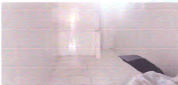
FOTO: ÁREA DE CIRCULAÇÃO