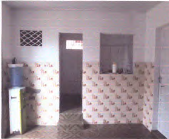
FOTO: COZINHA/ COPA