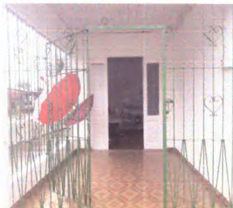
FOTO: ÁREA DE CIRCULAÇÃO