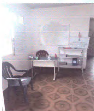
FOTO: SALA 3