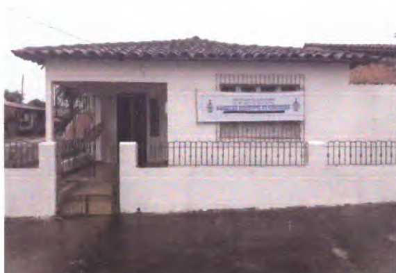
FOTO: VISTA FRONTAL