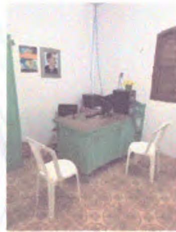
FOTO: SALA 2