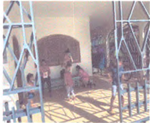
FOTO: ÁREA DE CIRCULAÇÃO