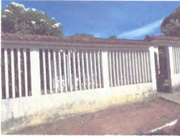
FOTO: VISTA FRONTAL