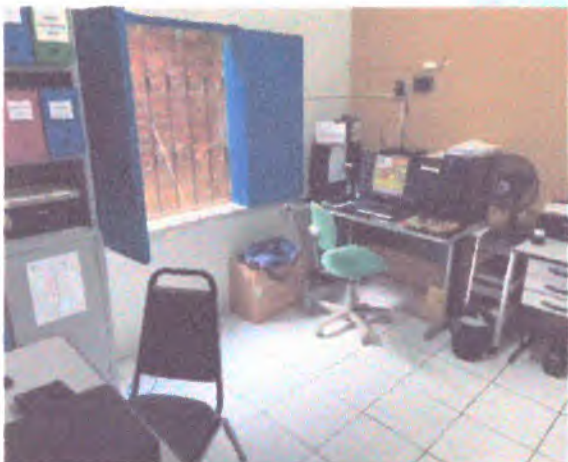
FOTO: SALA 1