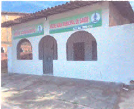
FOTO: VISTA FRONTAL