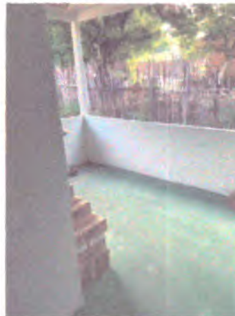
FOTO: ÁREA DE CIRCULAÇÃO