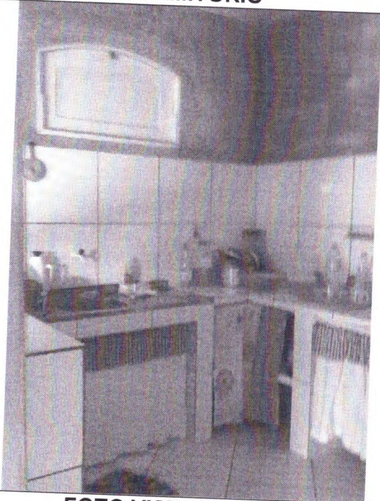
FOTO VISTA COZINHA