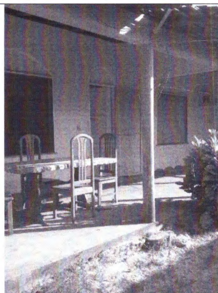
FOTO PORTA ACESSO PRINCIPAL