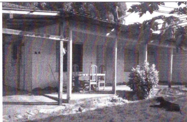
FOTO FACHADA VARANDA FUNDO