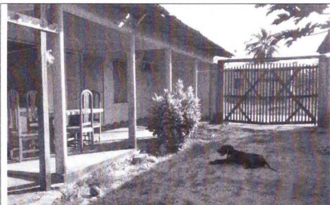
FOTO FACHADA VARANDA

OBJETO: LOCAÇÃO DE IMÓVEL RESIDENCIAL LOCALIZADO EM MARUDÁ RUA NOVA YORK, BAIRRO VILA NOVA, MUNICÍPIO DE MARAPANIM-PA DESTINADO AO FUNCIONAMENTO CASA DE APOIO PARA MORADIA DOS PROFISSIONAIS DA SAÚDE.